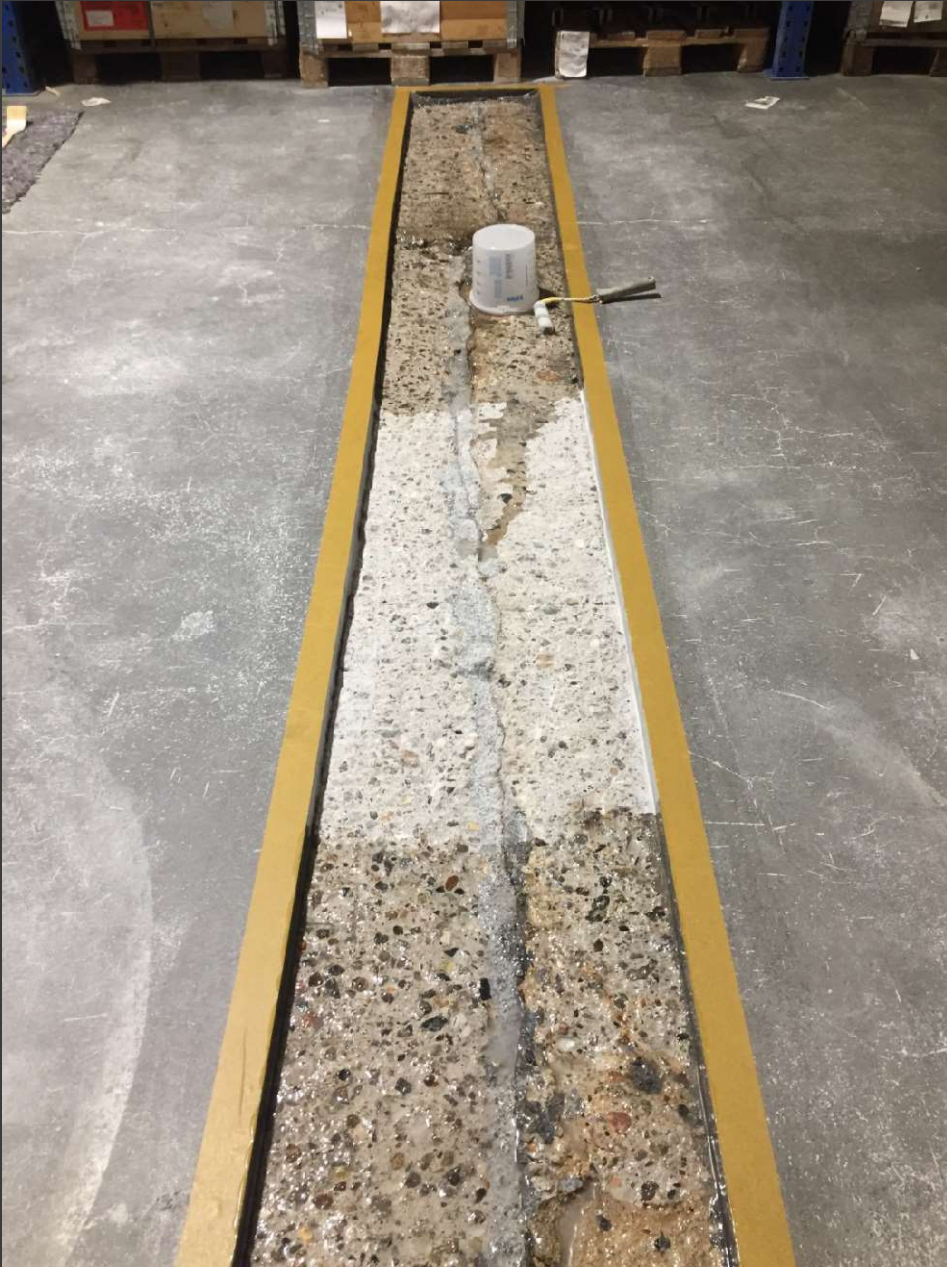
Grundierung der Bodenplatte mit Triflex Cryl Primer 276